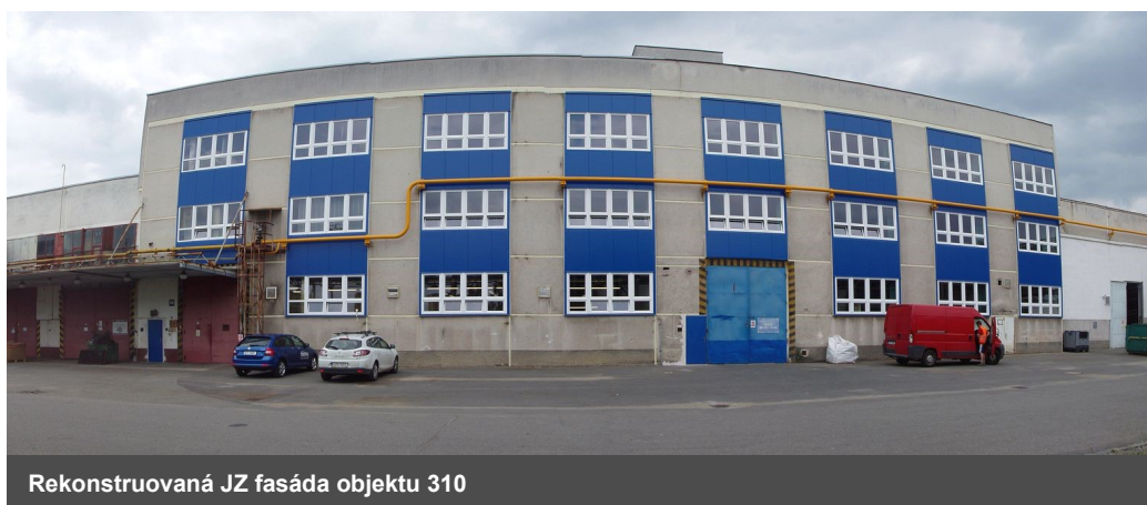
Rekonstruovaná JZ fasáda objektu 310